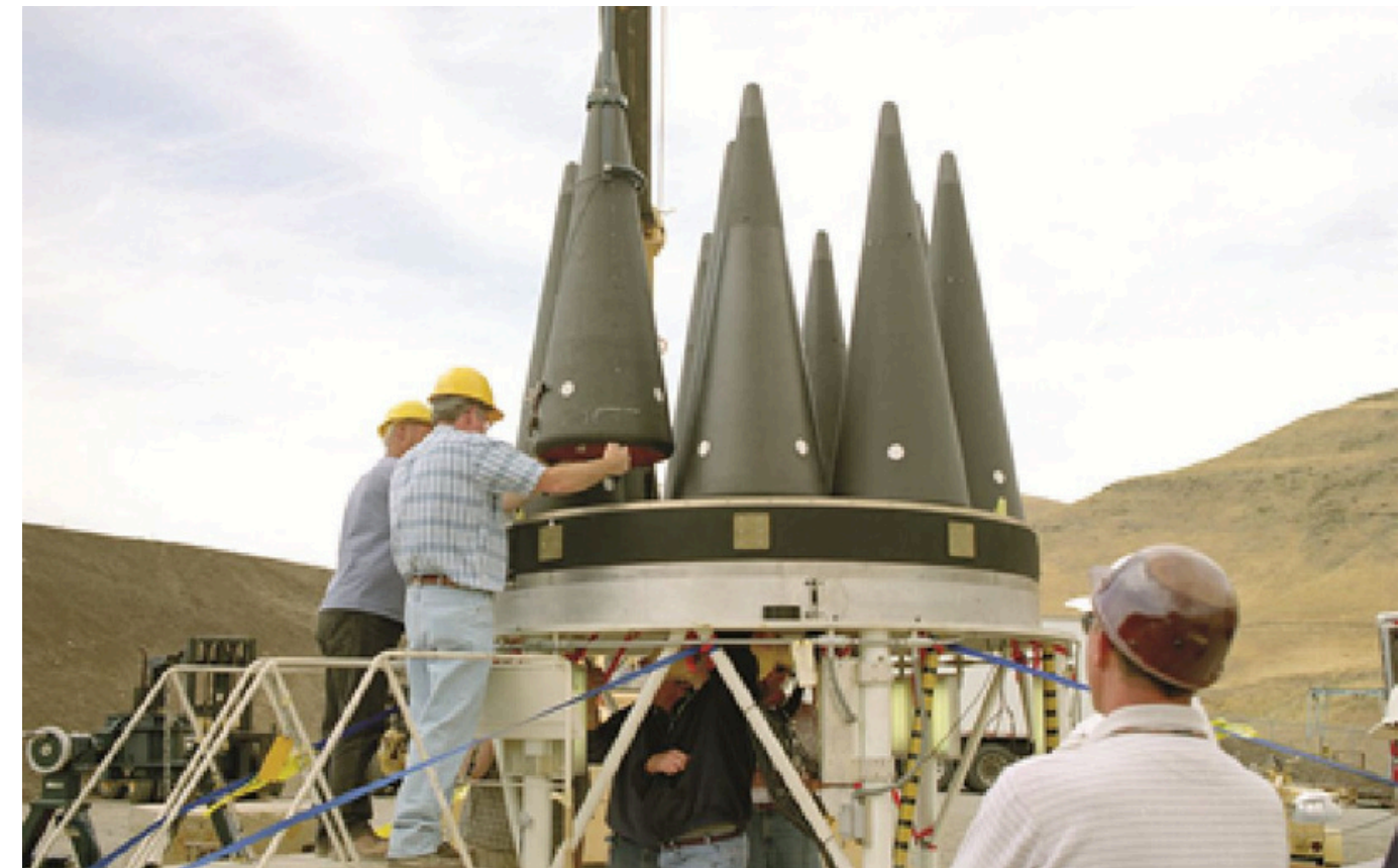
Imagen 1: Cabezas nucleares en el Laboratorio de Livermore